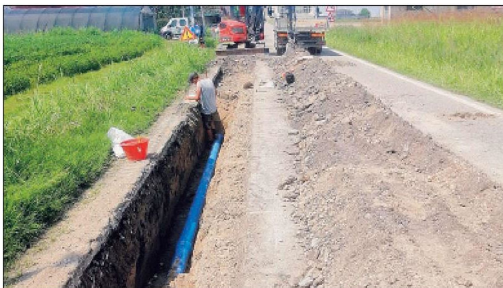
L'intervento in corso a Lusìa